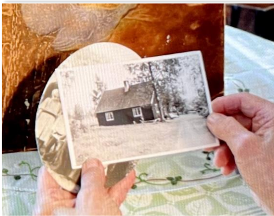
Nya Lövlunds före 1960