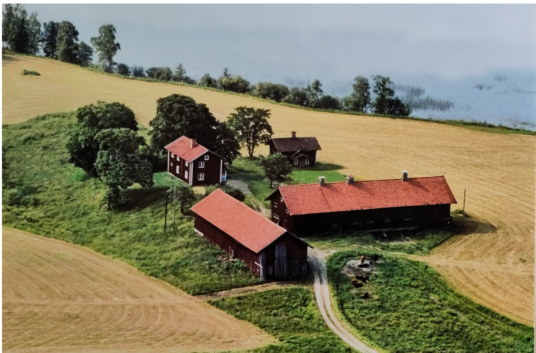
Flygbild över Stora Karsbo 6 juli 1981 med både bostadshusen och ekonomibyggnaderna.

Nuvarande bostadshus är troligtvis från mitten eller slutet av 1800-talet. Det fanns även en mindre bostadshus strax nedanför huvudbostaden. Det är inte känt när den byggdes. Den revs i början av 1980-talet, men syns fortfarande på en flygbild från 1981.