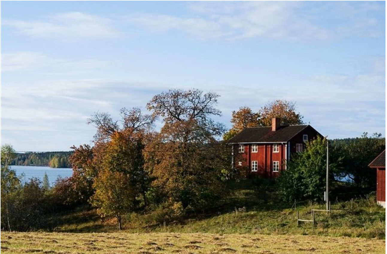
Stora Karsbo ca 2009.